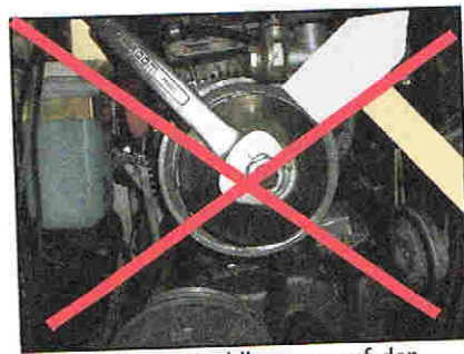
Fig. 1.3 Mit Stahlhammer auf den Schlüssel schlagen.