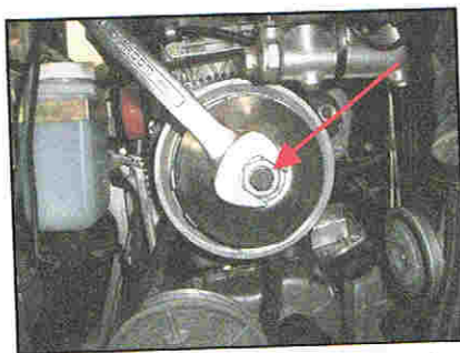
Fig. 1.2 Schraube am Variator abnehmen SW 13